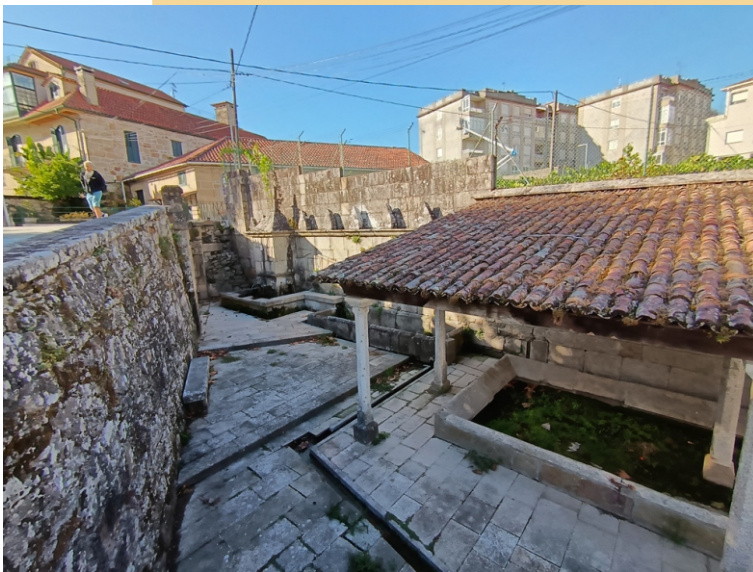
Fonte e lavadoiro