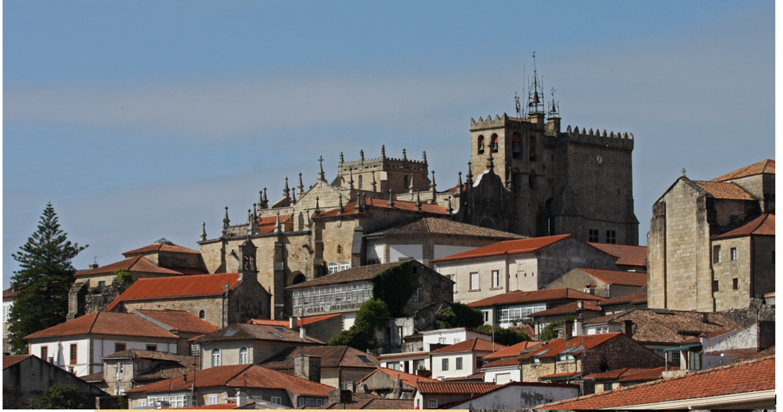
Vista do cunhw de Tui coa catedral no centro.