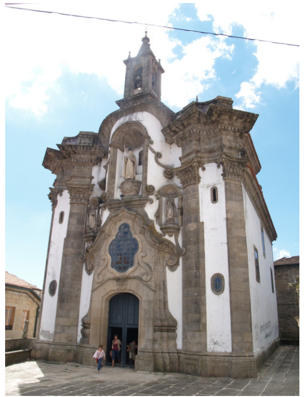
Igrexa de San Telmo