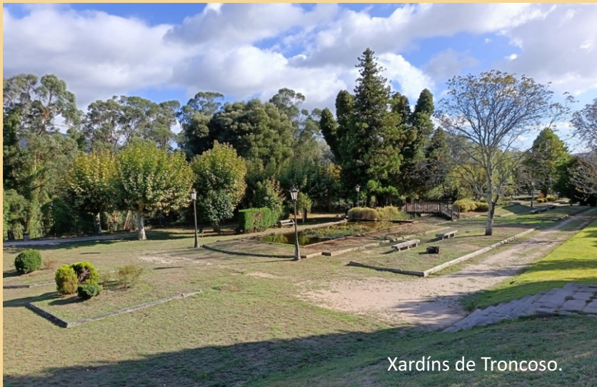
Xardíns de Troncoso.

Pechamos o percorrido volvendo da catedral aos xardíns polo Paseo da Corredoira, para gozar do espazo e ver o conxunto de San Francisco.