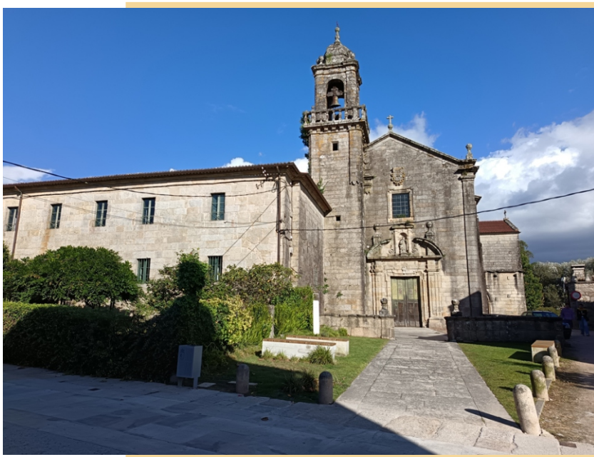
Mosteiro da Concepción Santa Clara (as Encerradas)