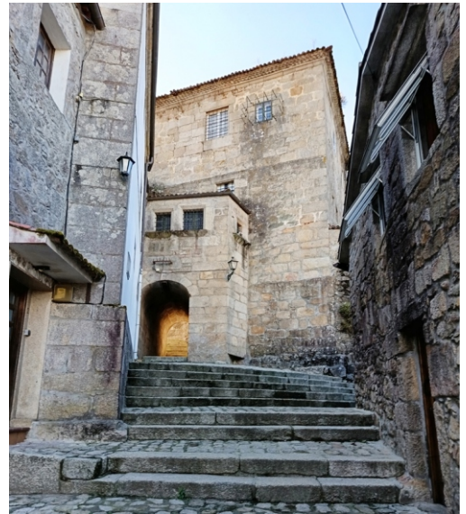
Rúa do Ouro e túnel das Clarisas.

Vista de Tui desde o miradoiro dos xardíns.