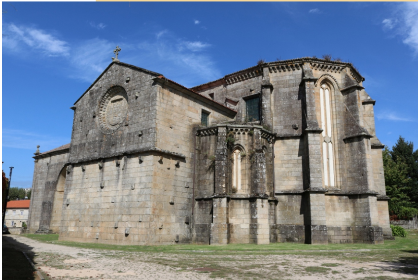
Ábsida e porta lateral do convento de San Domingos.