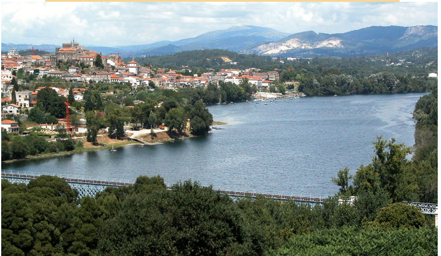
O río Miño e Tui desde Valença