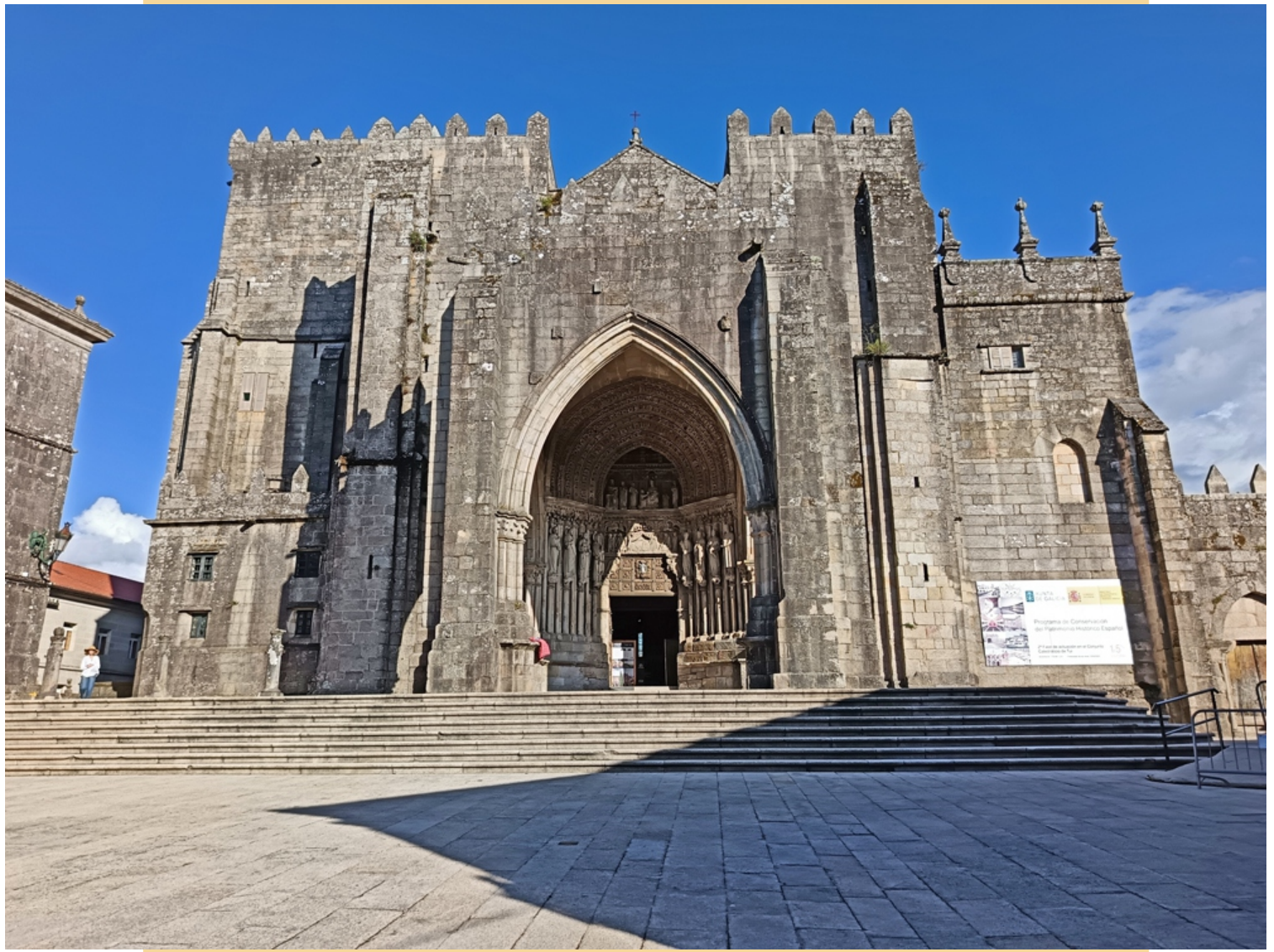
Catedral de Santa María.